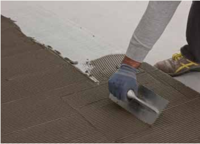
fig.36 / Auftragen des Klebers auf der Plattenrückseite. / Application de la colle au dos de la plaque.