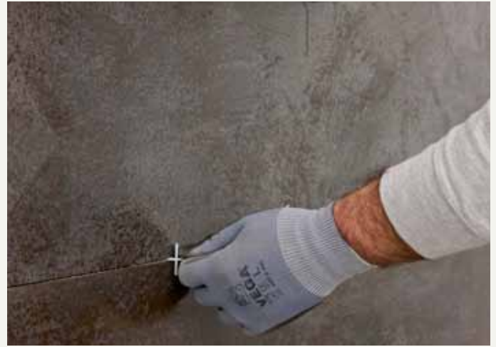
fig.37 / Fugen mit Abstandhaltern. / Jointoiement avec croisillons.