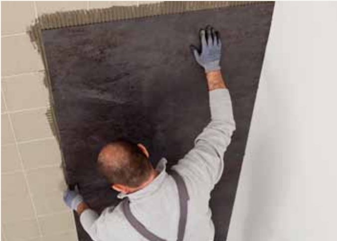
fig.38 / Verlegen der Platte. / Pose de la plaque.