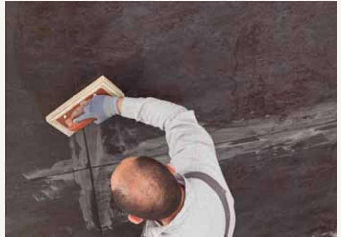
fig.39 / Verfugen. / Application de l'enduit de jointoiement.